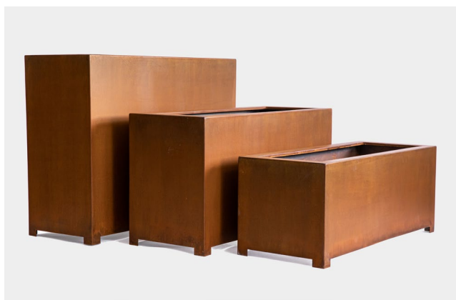
Вазон прямоугольный на ножках