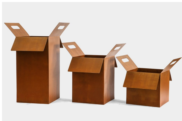
Вазон с ручками (коробка)