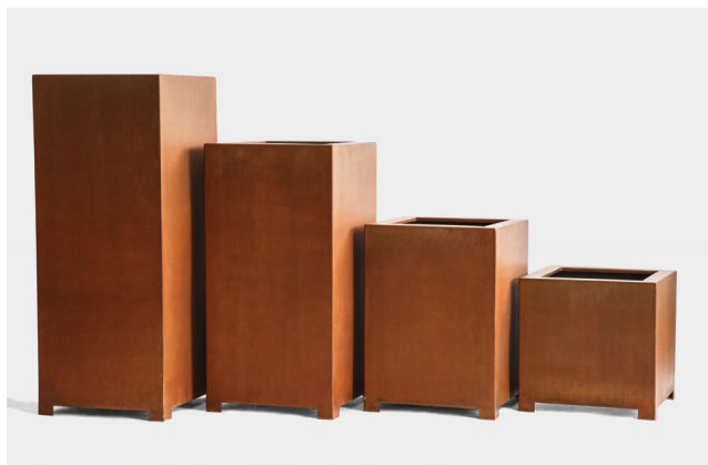
Вазон квадратный на ножках